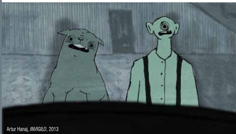
Artur Hanaj, INVIGILO , 2013