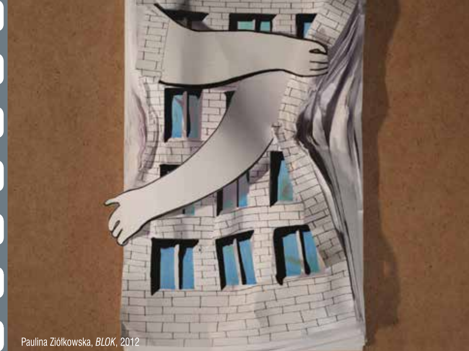
Paulina Ziółkowska, BLOK , 2012