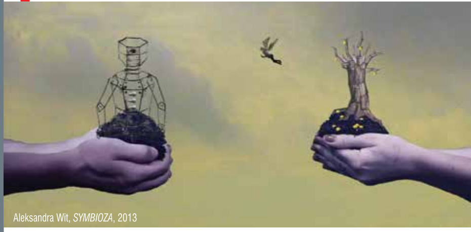
Aleksandra Wit, SYMBIOZA , 2013